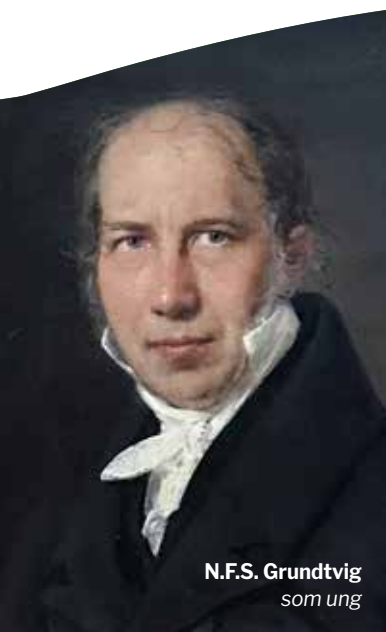
N.F.S. Grundtvig som ung

Et samarbejde mellem LOF og Jyllinge Kirke og Menighedsråd