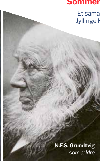
N.F.S. Grundtvig som ældre